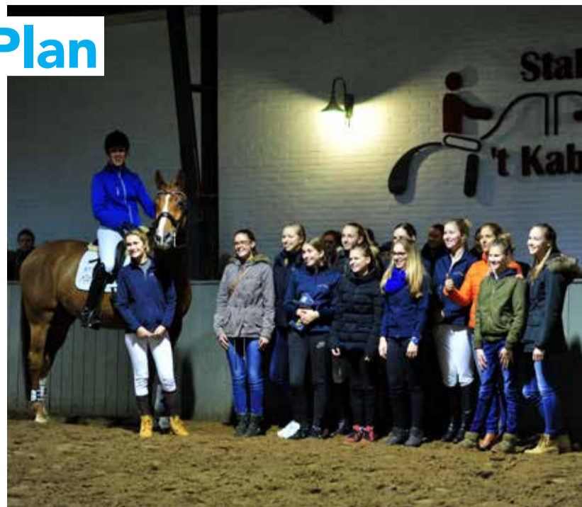
De 12 beloften van 2016 (een niet op de foto).

Naast de score van de proef, worden individueel de volgende eisen gesteld om geselecteerd te worden